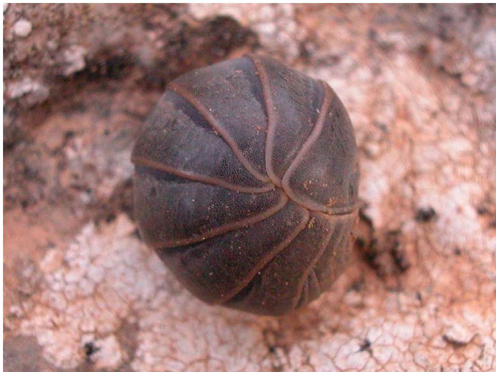
Fig. 4. Armadillidium officinalis . Exemplars de sa Dragonera. Fig. 4. Armadillidium officinalis . Specimens from sa Dragonera.

d'alguns exemplars de mida gran de sa Dragonera, ha mostrat una composició que en un gran percentatge està formada per restes d'artròpodes, seguit de matèria vegetal i partícules minerals. A les Balears, Armadillo officinalis , és una de les espècies més abundants tant en lloc humanitzats com dins el medi natural, ocupant igualment les zones de pinar com d'alzinar alterat i garrigues. També s'ha localitzat a l'entrada de coves.