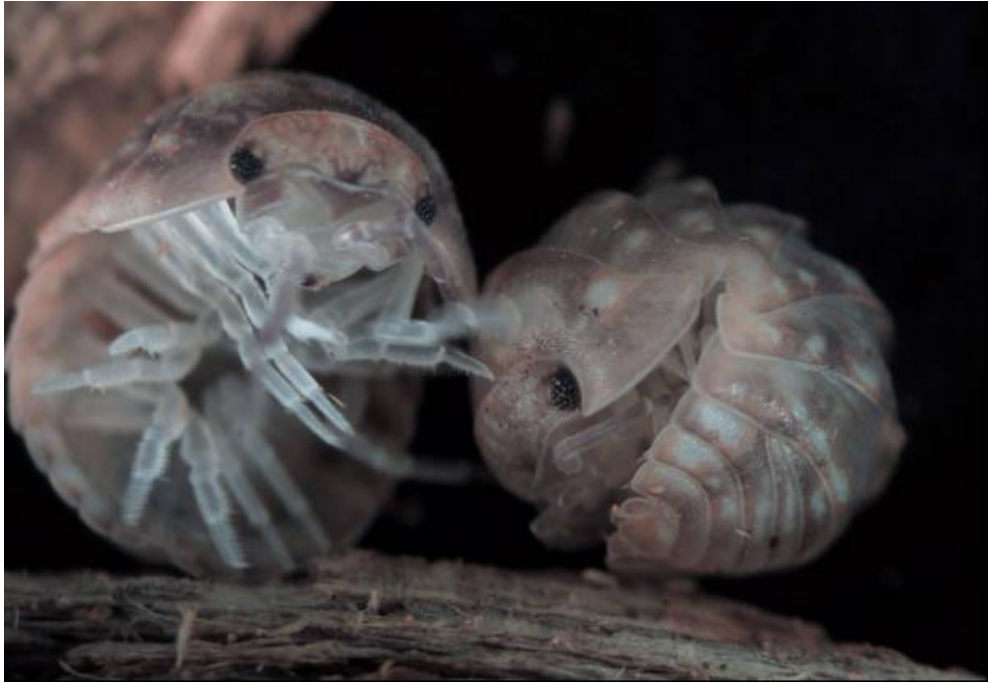
Fig. 2. Armadillidium cruzi Garcia, 2003. Exemplars de sa Dragonera.

Fig. 2. Armadillidium cruzi Garcia, 2003. Specimens from sa Dragonera.-